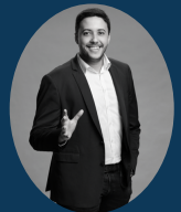
Mélik Webmarketeur Référencement SEO / SEA